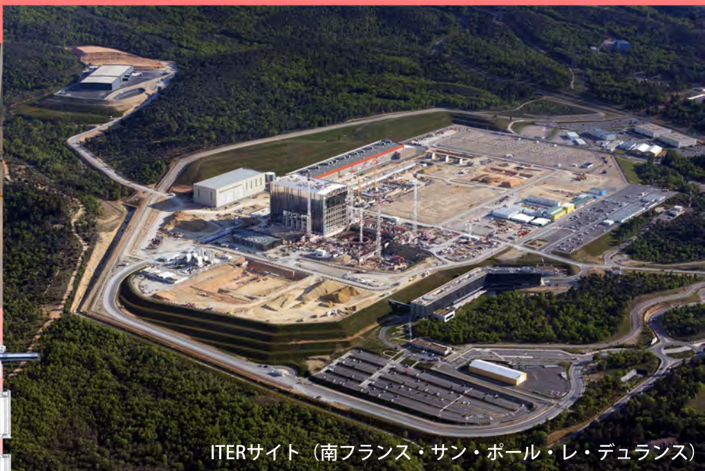
ITERサイト (南フランス・サン・ポール・レ・デュランス)